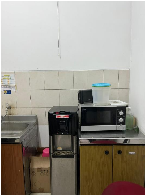
Lampiran 1 : Denah/ Layout Pantry Existing