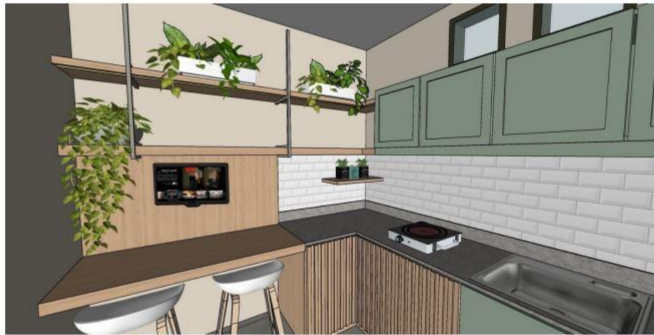
PANTRY - PERSPECTIVE VIEW (non-render)